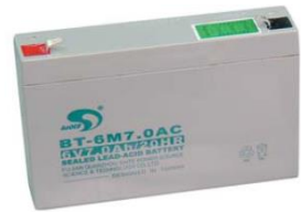
备用可充电电池一块