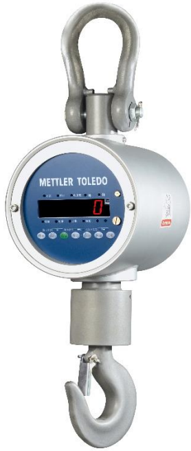
标准秤体一套(含：主用电池一块，LCD显示、称重传感器、高强度钩环)