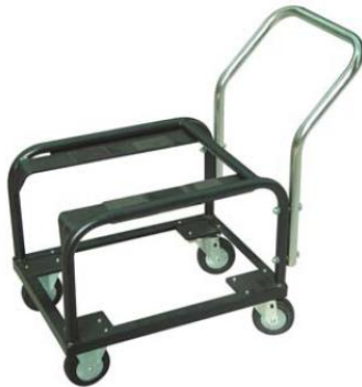
秤体存放小车一辆